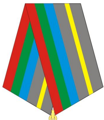
РИСУНОК медали Генерального штаба Вооруженных Сил Кыргызской Республики «Милдетке бекемдиги үчүн» («За верность долгу»)